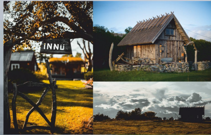
Vahtra talu Abruka saarel.

Abruka saare imeline loodus, huvitav arhitektuur ja sõbralikud inimesed pakuvad puhkusele lisaväärtust. Meiega saad teha saarele ringi peale auto kastis, tehes peatusi ja kuulata peremehe muhedat jutu saare inimeste, looduse ja ajaloo kohta. Olete oodatud külaline lõõgastuma ja nautima Abruka saare rahu ja vaikust, mis aitab argiritiini taastuda.